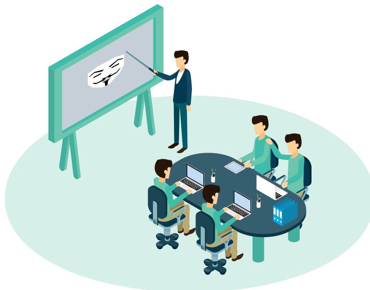
FIGUR 2. Diskusjonsøvelse

Hensikten med øvingsformen er å la øvingsdeltakerne komme frem, gjennom diskusjon og dialog, til de beste løsningene på en problemstilling og gjennom dette få en større forståelse for sin egen og andres rolle. Dette kan gjelde virksomhetens ansvar eller individers ansvar.