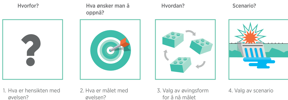
FIGUR 1. Spørsmål man bør ta stilling til forut for planleggingsprosessen

Disse spørsmålene bør drøftes før man velger øvingsform: