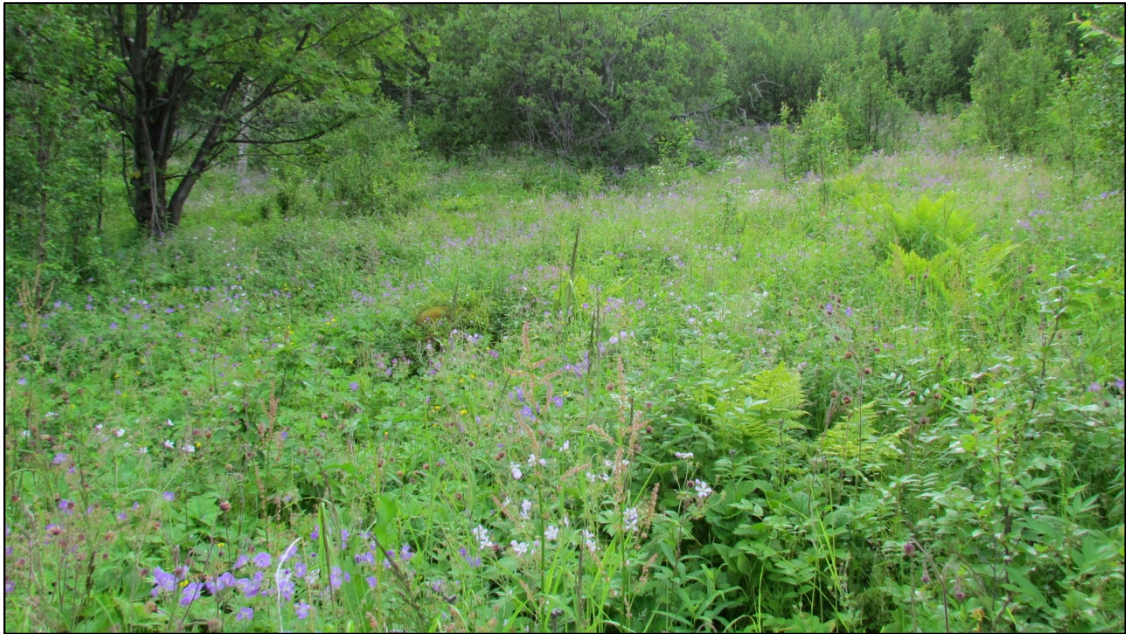
Figur 1. Lauveng (CR) under gjengroing i Skardalen, Kåfjord kommune. Det er oppslag av busker og vesentlig mer høyvokste stauder og bregner enn man får i velskjøttet lauveng

tresjiktet ble ikke regelmessig utnyttet til annet enn ved. Dette gir utforming lauveng med dunbjørk (D1703).