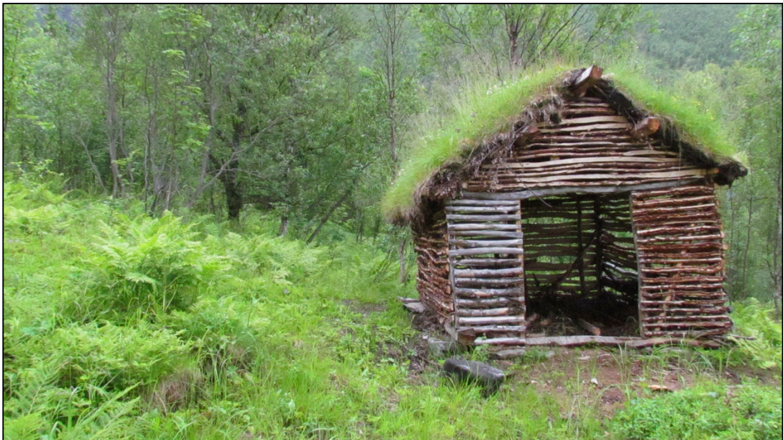
Figur 2. I nærheten de avgrensede områdene med skogslått er det satt opp en ny høylae bygget etter gammel byggesjikk.