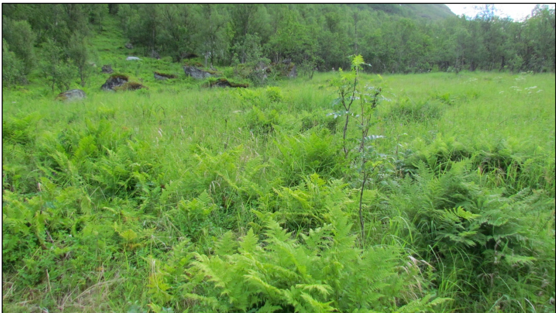
Figur 3. Lauveng (CR) under gjengroing i Skardalen, Kåfjord kommune. Området skal tilrettelegges for elg, og er under vurdering i forhold til restaurering og gjenopptak av tradisjonell skjøtsel av lauveng i kombinasjon med tilretteleggingsprosjektet.

For de avgrensede områdene i Skardalen er det gjengroing som er den viktigste trusselen. Det er flere trær og busker enn det var tidligere, og feltsjiktet domineres av større planter. På sikt vil dette føre til en flora knyttet til næringsrik bjørkeskog i stedet for lauveng.