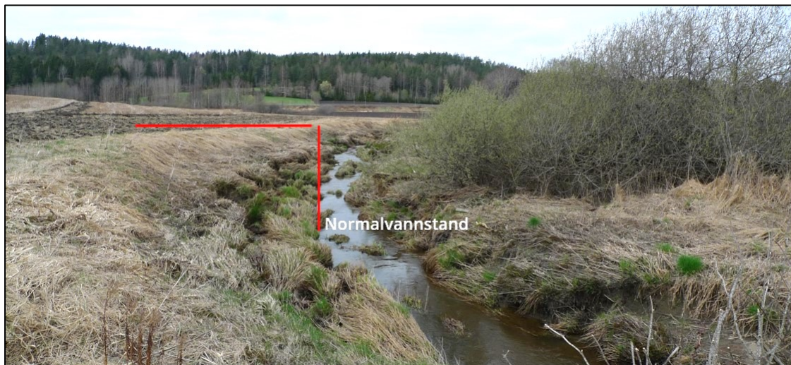
Bredden på kantsonen måles horisontalt fra vassdragets normalvannstand. Foto: Svein Skøien.

Dersom den naturlige kantsonen/vegetasjonssonen mellom jordbruksarealet og vassdraget er minst 8 meter bred, og denne består av varig vegetasjon, trenger du ikke å anlegge buffersone. Bredden på kantsonen skal måles horisontalt fra vassdragets normalvannstand.