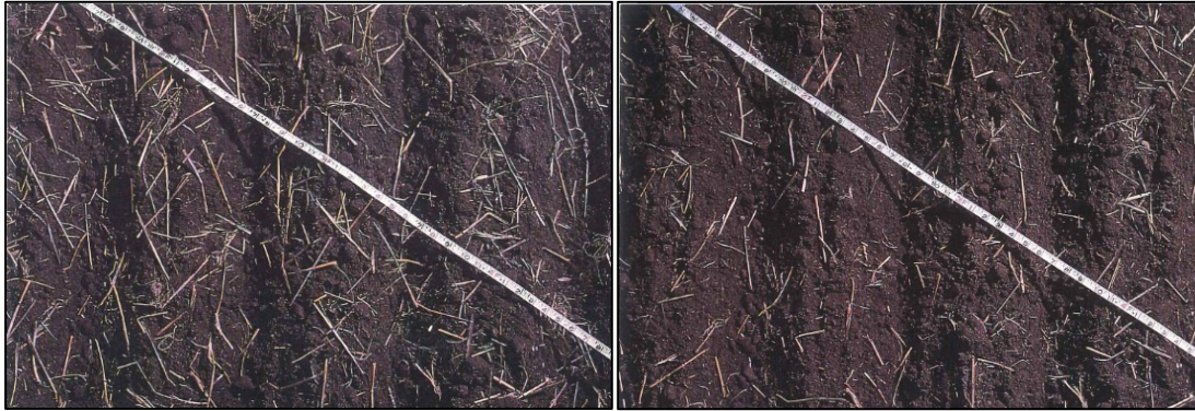
Bildet til venstre viser 30 % planterester på overflaten. Bildet til høyre viser 15 % planterester på overflaten.

Bildet til venstre viser 30 % planterester på overflaten, som er minimumskravet til planterester. Bildet til høyre viser 15 % planterester på overflaten. Dette oppfyller ikke kravet til planterester.