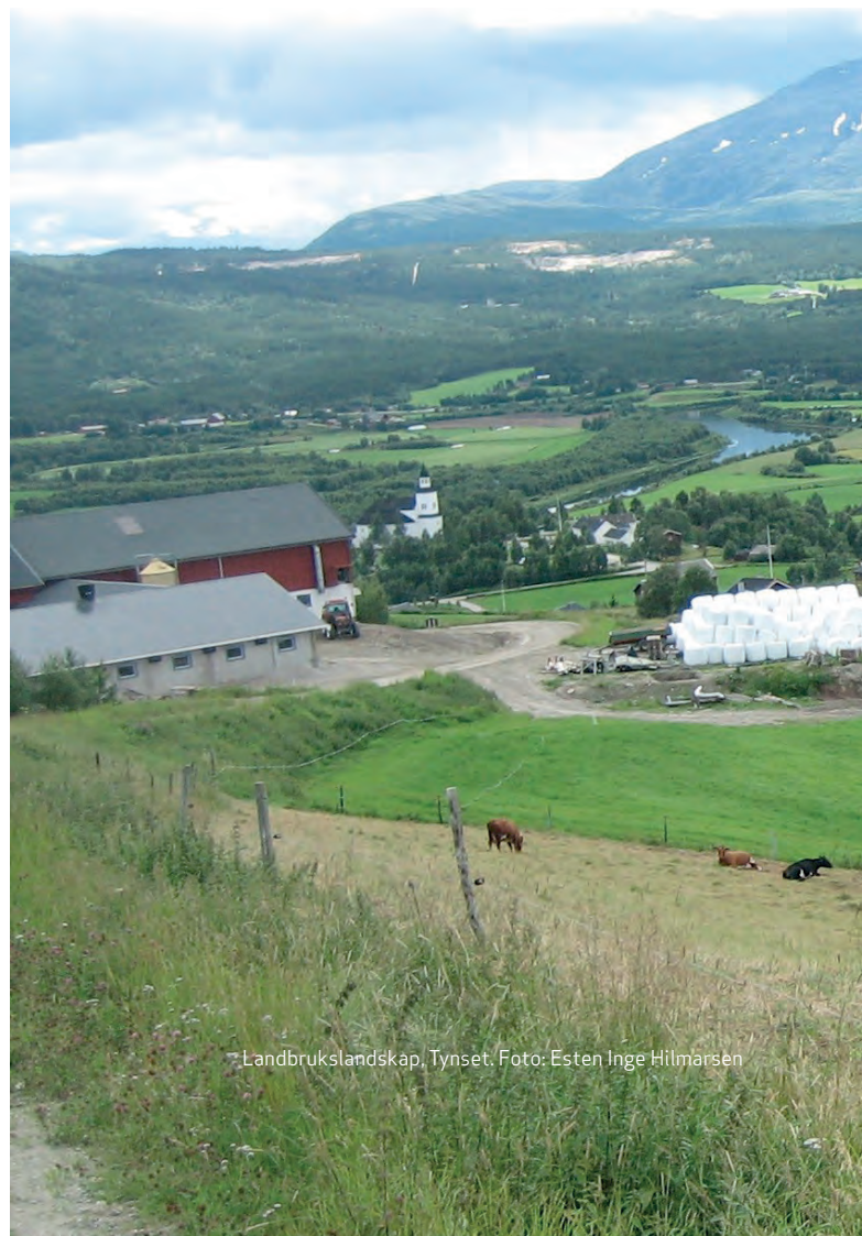
Landbrukslandskap, Tynset.

Tabellen på neste side viser innvilget tilskuddsbeløp av investerings- og bedriftsutviklingsmidlene (IBU-midlene) i millioner kroner siste fem år. Hedmark og Oppland har til nå hatt separate programmer og med litt ulike prioriteringer. Dette gjenspeiles i noe ulik fordeling av tilskudd mellom produksjoner (og år) i de to fylkene. Valdres og Nord-Gudbrandsdal hadde egne tildelinger fram til og med 2014. Det mangler fordeling mellom produksjoner for disse regionene i de aktuelle årene.