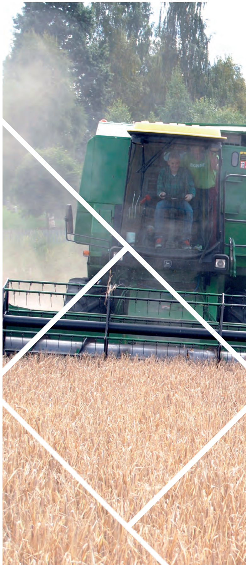
Tresking, Stange.

Styringsgruppa skal ha minst én årlig gjennomgang av status og utvikling i de enkelte produksjoner, regioner og kommuner. I dette møtet skal det diskuteres behov for justeringer og satsinger, samt eventuelt behov for detaljerte føringene innenfor de overordnede føringene gitt av Regionalt næringsprogram, forskrift og jordbruksavtale.