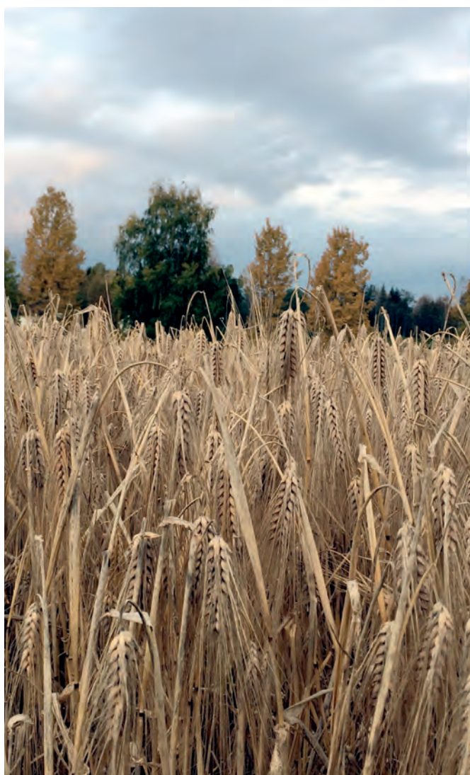
Kornåker, Hamar.

I planteproduksjon er det største investeringsbehovet å sikre bedre tørke- og lagringskapasitet på den enkelte gård. Innen kornproduksjonen har korn tørker på egen gård igjen blitt aktuelt de siste årene der fuktig vær flere høster har gitt få tresketimer, fuktig korn og dertil utfordringer med mottakskapasiteten på kornmottakene. Det er også et oppgraderingsbehov for en del gamle vanningsanlegg, noe som er viktig i somrer med lengre, sammenhengende tørkeperioder.