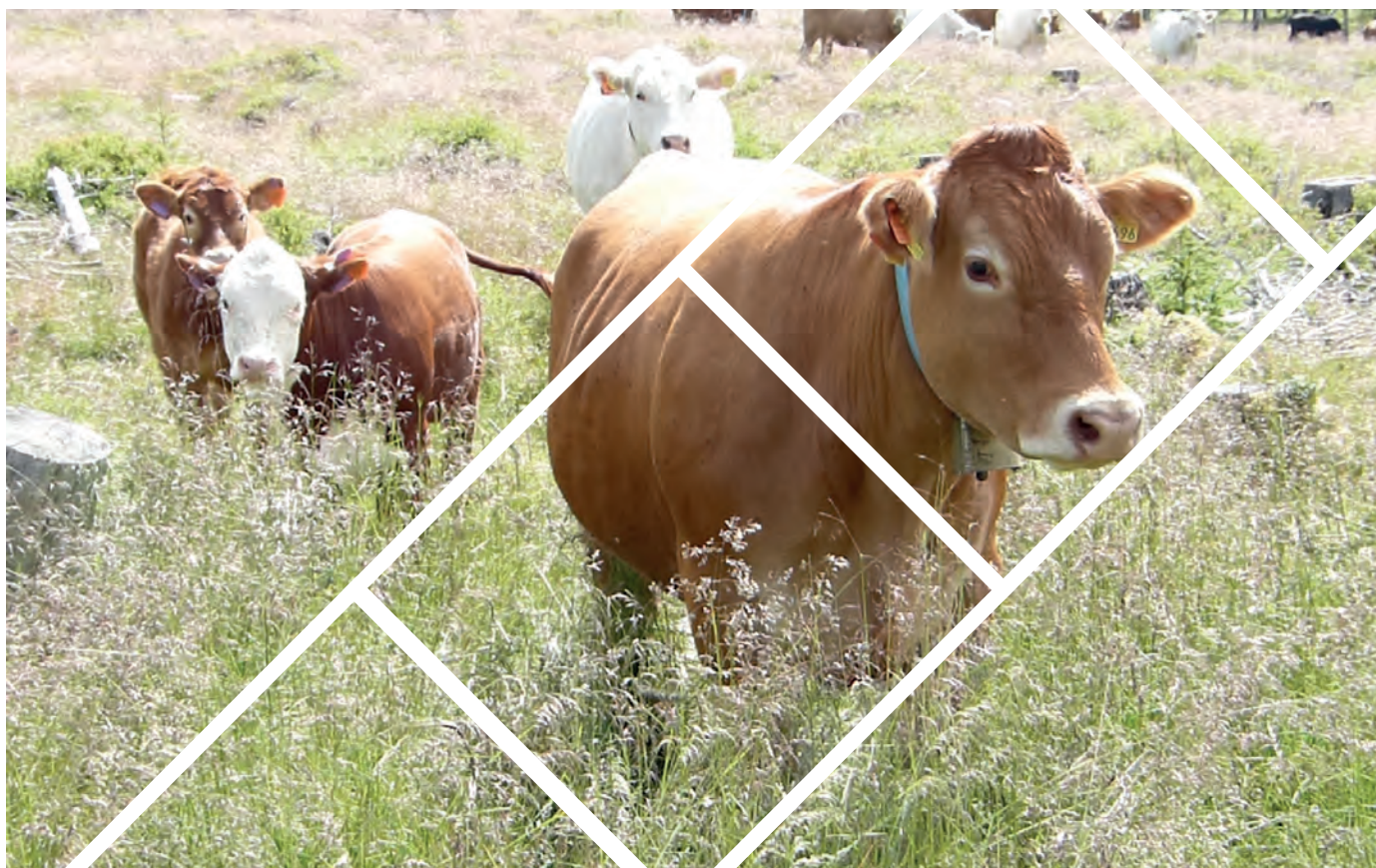
Det har vært en stor økning i ammeku-produksjonen i Innlandet. Ammeku på utmarksbeite i Ringsaker.

Det har vært stor endring i produksjonsomfanget som følge av at en del har gått over fra mjølkeproduksjon til ren kjøttproduksjon, samt mange nyetableringer og utvidelser av eksisterende ammeku-produksjon. Tall fra Innovasjon Norge viser at i femårsperioden 2013–2017 har 117 bruk i Hedmark og 72 bruk i Oppland fått investeringsstøtte fra Innovasjon Norge for ammeku-produksjon. Hedmark er det fylket hvor det er gitt støtte til flest investeringsprosjekter med ammeku. Prosjektene har til sammen utløst 3 730 morderplasser til ammeku i Hedmark og 2 461 morderplasser til ammeku i Oppland. Strukturen endret seg fra 22,7 kyr per bruk i 2013 til 25,8 kyr per bruk i Hedmark i 2017. I Oppland er tilsvarende endring fra 17,0 kyr per bruk i 2013 til 19,9 kyr per bruk i 2017.