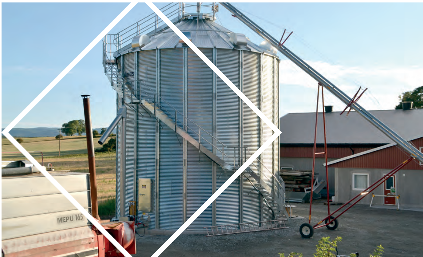
Korntørke i Stange

All økologisk produksjon er gitt førsteprioritet for tildeling av IBU-midler med bakgrunn i en politisk målsetning om å øke andelen økologisk produksjon innen alle landbruksproduksjoner.