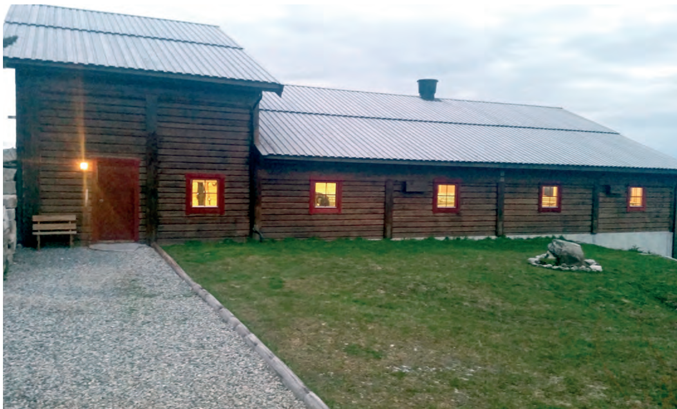
Det er et ønske om økt bruk av tre i driftsbygninger.

I tillegg sier forskriften at det kan gis høyere tilskuddsandel for enkelte tiltaksgrupper av IBU-midler til personer under 35 år og til kvinner.