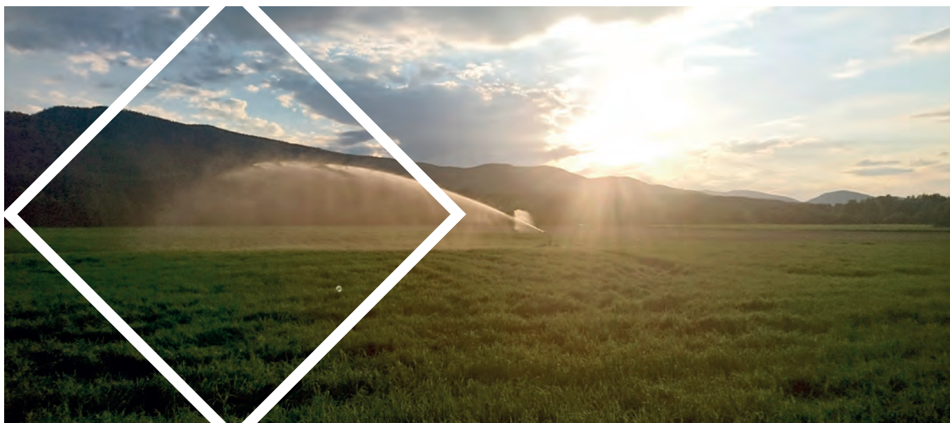
Vanning, Stor-Elvdal.

og Hedmarken, noe som skyldes et stort og aktivt husdyrmiljø i disse regionene. Sør-Østerdalen og til dels Glåmdalen har enkelte år ikke hatt nok innvilgede prosjekter til at regionene har fått innvilget tilskudd tilsvarende fordelingsnøkkel. For Sør-Østerdal skyldes dette blant annet en uttynning av fagmiljøet over tid og dermed mindre investeringsvilje.