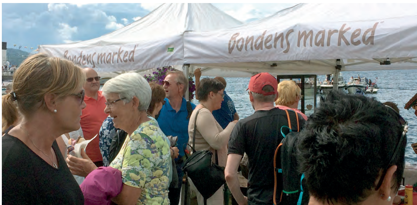
Bondens Marked da Skibladner la til kai ved Atlungstad under NRKs Sommerbåtsending.

I Innlandet har det vært en svært positiv utvikling for det landbruksbaserte reiselivet, og dette har blitt våre stolthetsprodukter. Mange av aktørene tilbyr lokalmat på menyen, og aktørene samarbeider godt innenfor etablerte nettverk, som for eksempel Mjøsgårdene og satsingen på stølsturisme i Valdres. Også arrangementer som ikke er type matfestivaler har koblet lokalmat opp mot opplevelsene, eksempelvis NRKs sommeråpnet med Skibladner og sommertoget. I disse sommerprogrammene var reiselivsnæringen i Innlandet svært opptatte av å få vist frem mat, kultur og det landbruksbaserte reiselivet. Dette er en utvikling som forventes å øke. Også hotellene i Innlandet satser på lokalmat. Et eksempel er Scandic Innlandet som har utviklet en egen lokalmatmeny i samarbeid med BAMA og lokale produsenter. Hanen, som er et landsdekkende nettverk/medlemsorganisasjon for bygdeturisme, gardsmat og innlandsfiske, har om lag hundre medlemmer i Oppland og Hedmark. Reiselivsnæringen kan vise til gode tall for reiselivet i Innlandet, og NHO peker på denne næringen som et av satsingsområdene i årene som kommer.