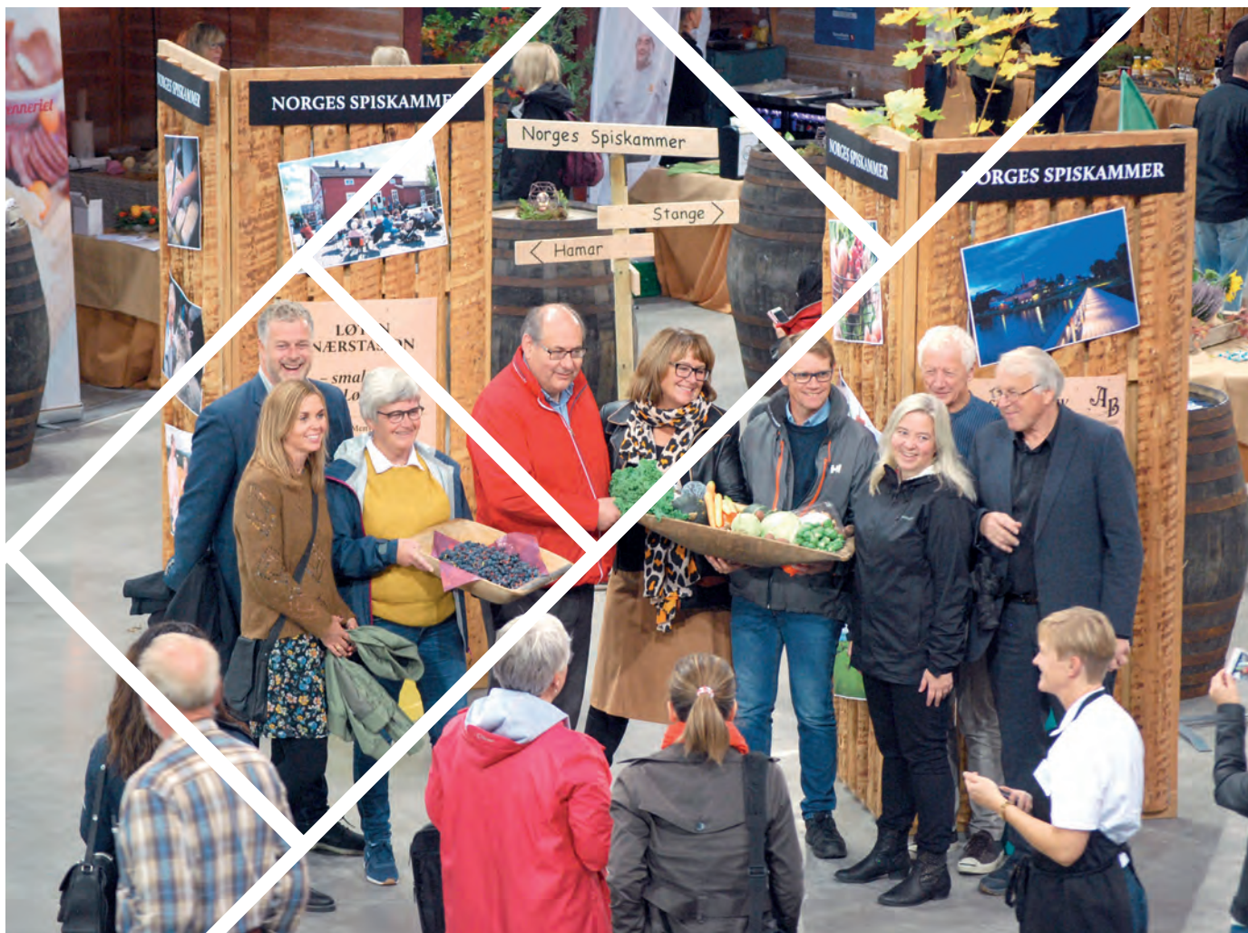
Stor oppslutning om Midt i matfatet i Vikingskipet.

mat og drikke kan vi nevne Gudbrandsdalmat, Mat fra Toten, Mat fra Valdres, Smak av Innlandet og Rørosmat. Bondens marked Innlandet er en stor omsetningskanal for lokalmat. Rekorder har blitt en effektiv omsetningskanal mellom produsent og kunde flere steder i Innlandet. I tillegg har flere typer utsalgssteder av lokalmat blitt etablert. Bolleland på Espå er en av de største omsetningskanalene for lokalmat. Det selges også lokalmat fra flere gårdsutsalg, landhandlerier og dagligvarebutikker. Etter spørslene forventes å være økende fremover. I Innlandet har det de siste årene også vært satset på ulike typer matfestivaler. Midt i matfatet på Hamar, Matauk på Lillehammer, Akevittfestivalen på Gjøvik, Spekematfestivalen på Tynset, Rakfiskfestivalen i Valdres og Mandelpotetfestivalen på Alvdal er festivaler som når et stort publikum og som har ambisjoner om å vokse. Også arrangementer som ikke er type matfestivaler, eksempelvis Idrettsgallaen, idrettsarrangementer og musikkfestivaler har fått lokalmat inn som en del av opplevelsen.